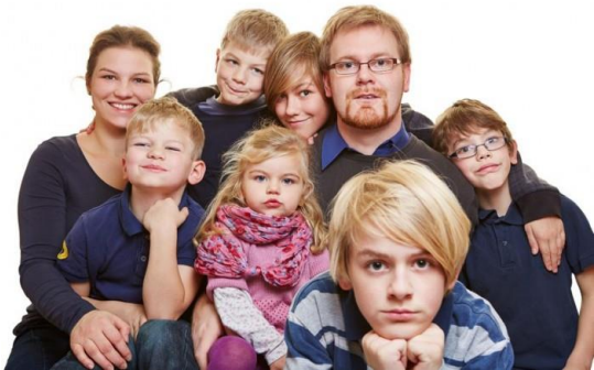
Familia Numerosa Especial, un oasis en el desierto demográfico.